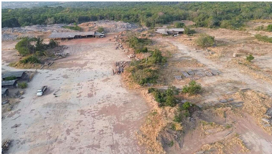
Imagem tirada de drone no dia da vistoria

PODER JUDICIÁRIO DO ESTADO DE MATO GROSSO COMARCA DE JUARA