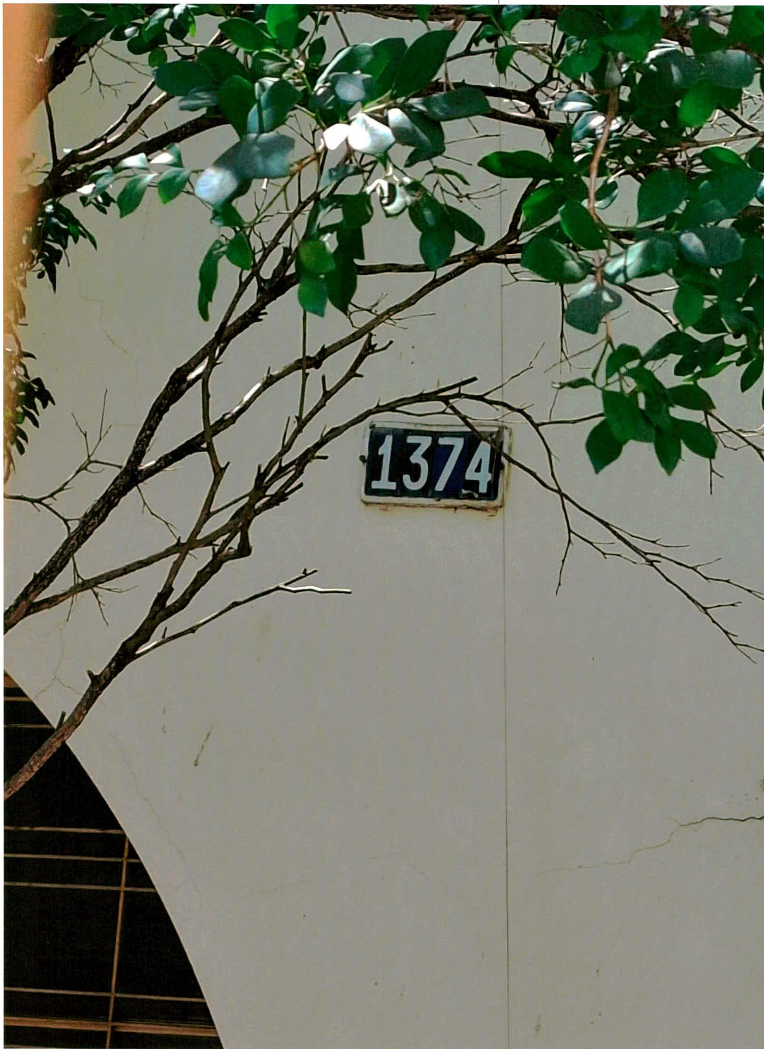
Numero 1374, Avenida Dom Bosco, centro, Cuiabá m.t;